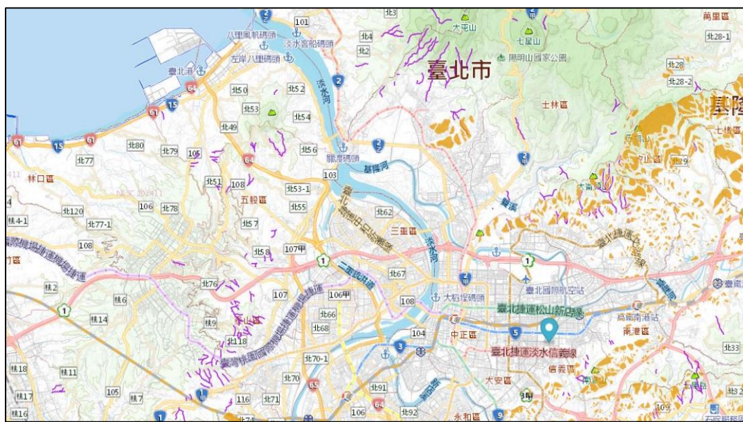
圖5 臺北市土石流及順向坡災害潛勢地圖

本市市中心區域位於臺北盆地底部，大屯火山群位於市區北邊與新北市接壤處，整個山系於市區內大致向南延伸並趨緩，直抵圓山、大直與內湖等地，是臺北市境內最大的山系；最高的七星山為 1,120 公尺，次高的大屯山為 1,092 公尺，山系中心地帶與北投側的外緣地帶有不少火山地形。市區東邊的內湖、南港與南邊的木柵多為丘陵地形；標高約 300 多公尺的南港山系則橫互於信義、南港兩區之間。坡地災害範圍廣泛，包含土石流、山崩、地滑及順向坡所引起之災害等，其主要受山地坡度、水、地震及人為影響，本市為盆地地形，四周為山地，常遭遇颱風、暴雨等侵襲，易造成土石流之發生(如圖 5)。