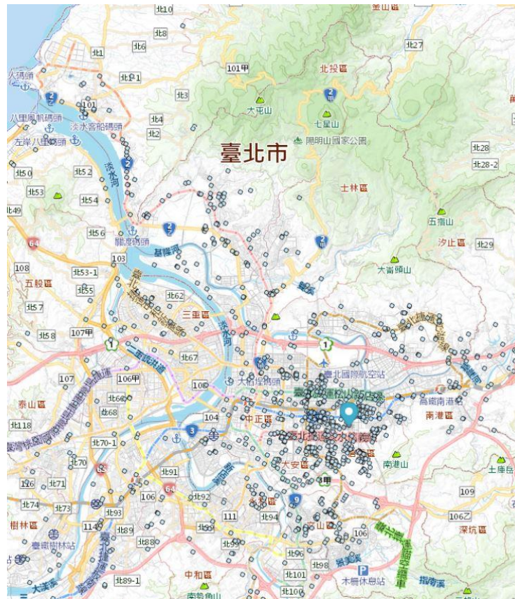
圖6 臺北市近五年淹水點

颱風主要生成季節是在 7 至 10 月，平均約有 18.3 個，佔全年颱風生成總數的 69%，若颱風停留時間過久及特殊嚴重水患，以民國 90 年 9 月中旬納莉颱風為例，於本市降下豪大雨量，遠超過臺北市下水道系統之設計容量，除造成臺北市捷運及臺鐵臺北車站淹水外，亦使內湖、南港、信義、松山等行政區幾乎全區淹水(如圖 6)。