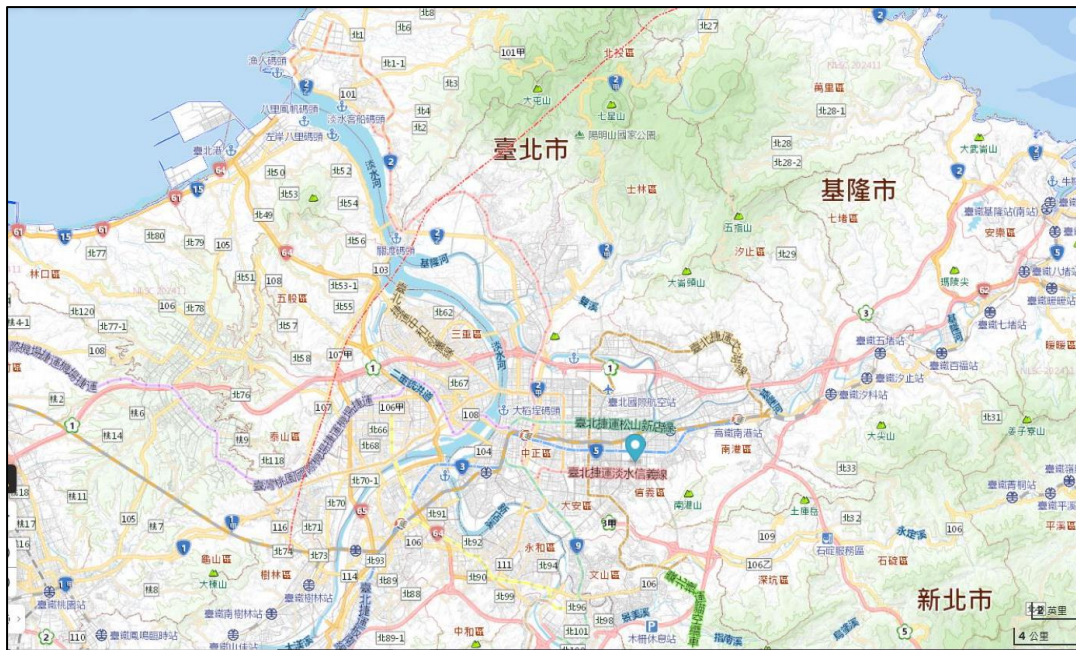
圖4 臺北市鄰近活動斷層分布圖