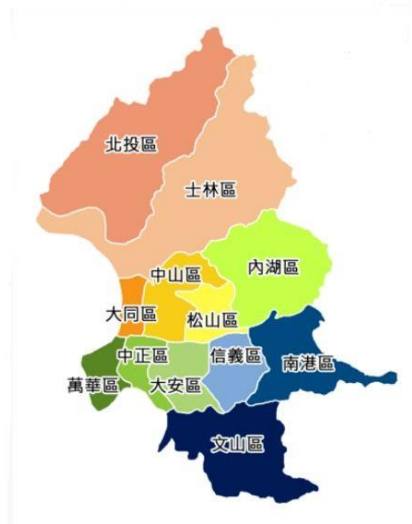
圖 2 臺北市行政區圖

本市四周均與新北市交界，土地面積約 271.7997 平方公里，轄區劃分為十二個行政區，分為松山區、大同區、內湖區、士林區、信義區、萬華區、大安區、中山區、南港區、北投區、中正區及文山區，設籍臺北市人口約 250 萬人（如圖 2、圖 3）。