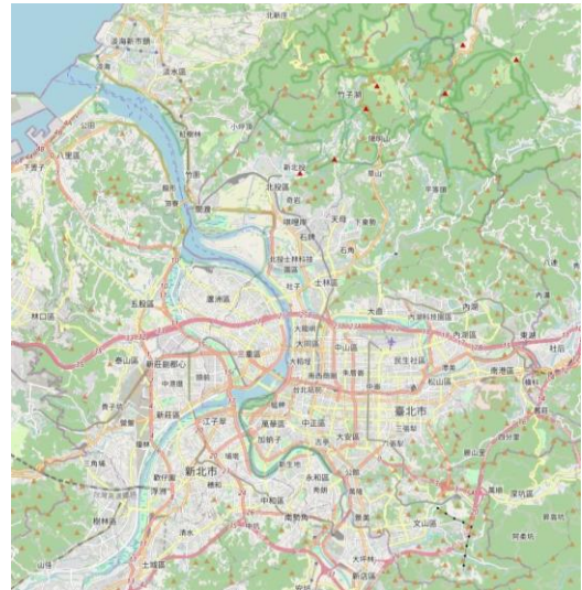
圖 3 臺北市地形圖

本市常見災害類型主要分為地震災害、坡地災害、颱洪災害與人為災害四類。依據教育部公告全國各級學校災害潛勢結果及本局災害潛勢評估，本局所屬學校災害潛勢分析結果如下表：