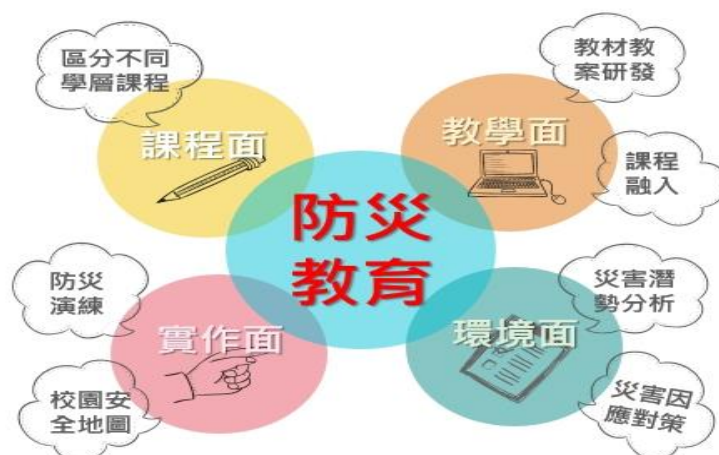
圖 1 防災教育計畫目標