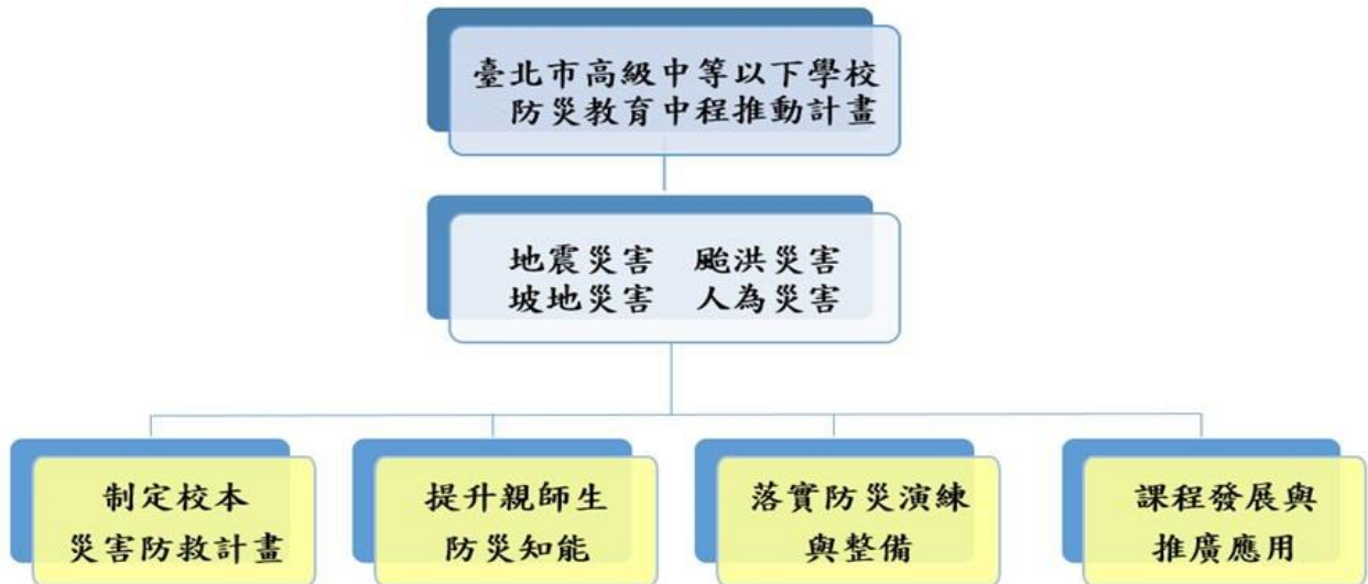
圖 7 臺北市政府教育局高級中等以下學校「防災教育中程實施計畫」114-116 年中程計畫架構